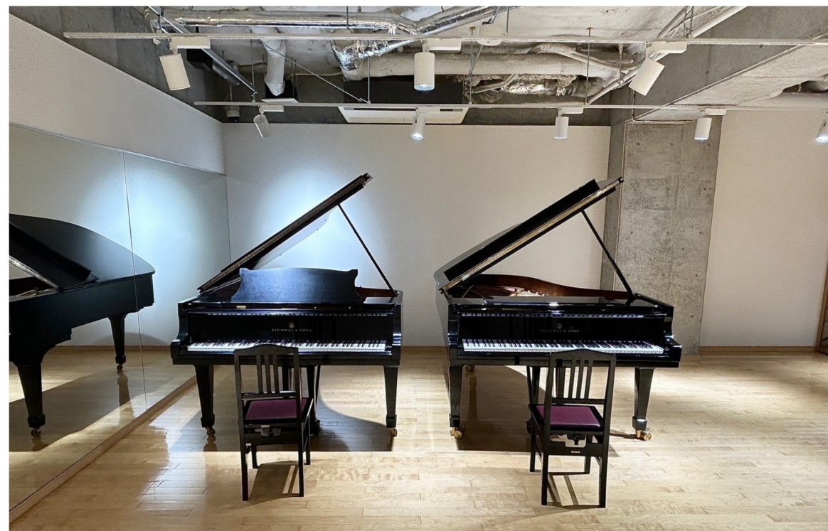
ピアノ：Steinway & Sons Model B